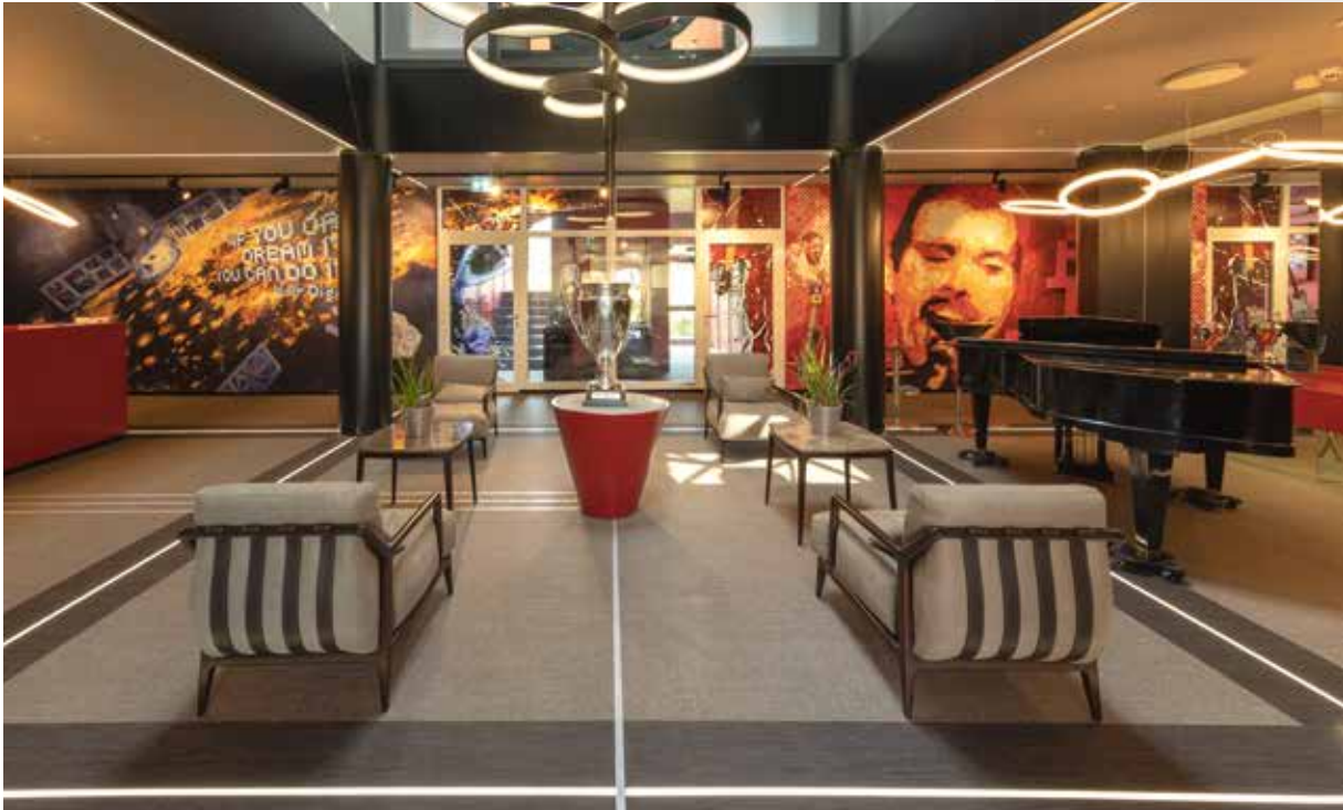
Film: Champions Future Center we Flonheim